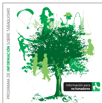
información para no fumadores