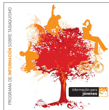
información para jóvenes