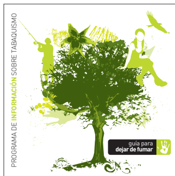
guía para dejar de fumar