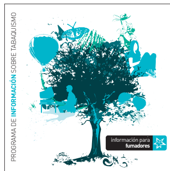
información para fumadores