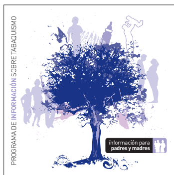
información para padres y madres