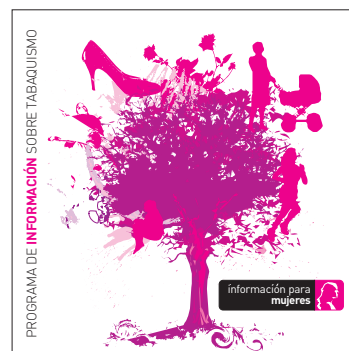
información para mujeres