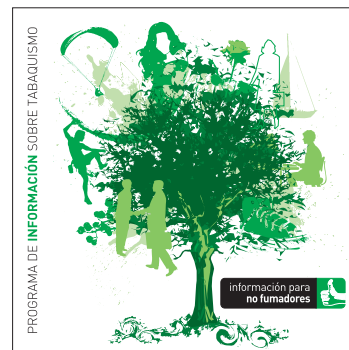
información para no fumadores