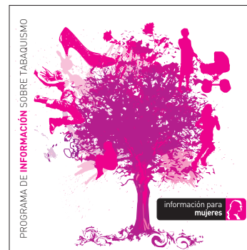
información para mujeres