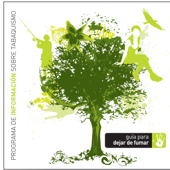
guía para dejar de fumar