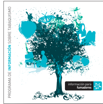
información para fumadores