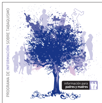
información para padres y madres