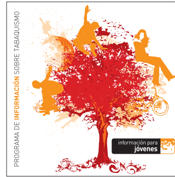
información para jóvenes