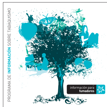
información para fumadores