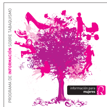
información para mujeres