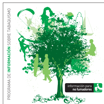
información para no fumadores