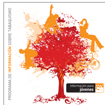
información para jóvenes