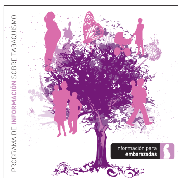
información para embarazadas