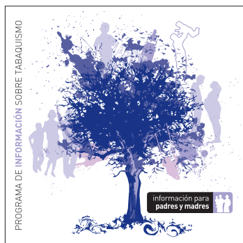
información para padres y madres