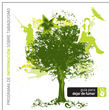
guía para dejar de fumar