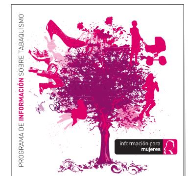
información para mujeres