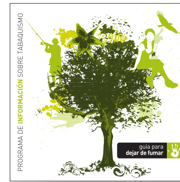
guía para dejar de fumar