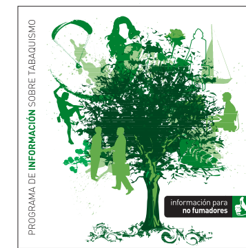
información para no fumadores