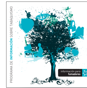
información para fumadores