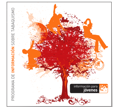
información para jóvenes