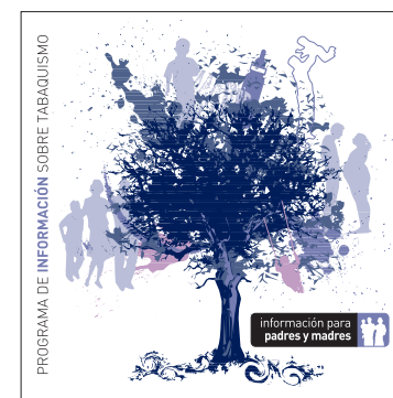
información para padres y madres