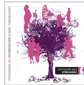
información para embarazadas