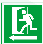
Salida de emergencia