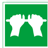
Salida de emergencia Empujar la barra