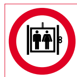
Ascensor No utilizar en caso de incendio