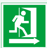
Salida de emergencia