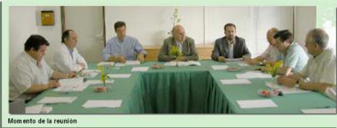
Momento de la reunión

capítulo de personal, y se elevó consultar a los Plenos de los distintos Ayuntamientos para después ser aprobados en Consejo de Gobierno. Una vez aprobado lo anterior, el siguiente paso consiste en que la FHC reciba una Encomienda de Funciones que posibilite un entorno de gestión similar a los demás hospitales de la red del SMS.