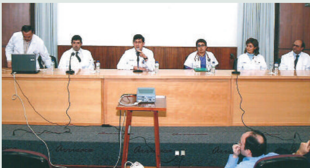
Un instante de la charla impartida en el Salón de Actos del Hospital Virgen de la Arrixaca.

El Servicio de Psiquiatría del Hospital Universitario Virgen de la Arrixaca ha conmemorado los 30 años de Psiquiatría con unas jornadas en las que se ha analizado la actividad de la profesión en la Región de Murcia durante este período de tiempo. Durante dos días, los especialistas abordaron temas como la aportación de los nuevos psicofármacos, la Unidad Abierta de Psiquiatría y las nuevas propuestas terapéuticas del siglo XXI.