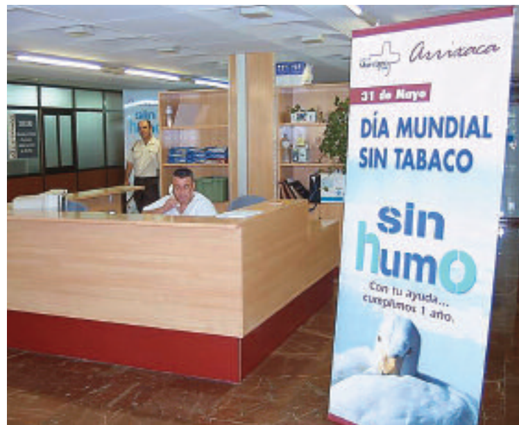
Los celadores han realizado la vigilancia de las zonas comunes del Hospital en el programa Arrixaca sin humo, que se muestra en las imágenes del Centro.