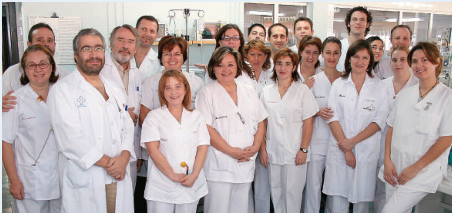
El equipo de profesionales de la UCI Neonatal cuenta con unas instalaciones recientemente ampliadas.