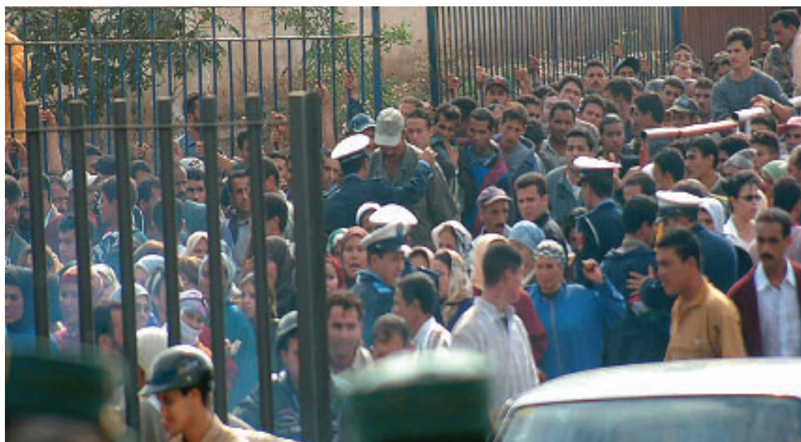
La avalancha de inmigrantes que llegaban malheridos al CETI hizo necesaria la colaboración de más profesionales médicos en el Centro para atender multitud de patologías de medicina general.