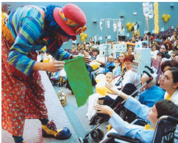
Una imagen de archivo de la fiesta con los Payasos de Hospital.