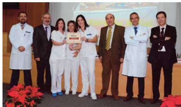
Premio al belén original para la segunda planta derecha.