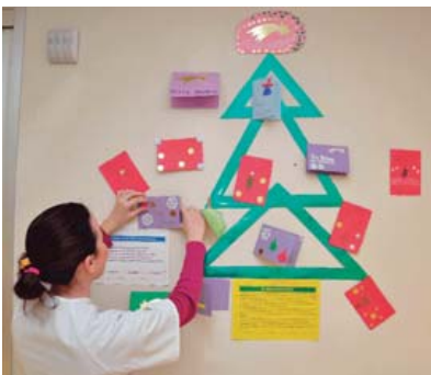
El Árbol de los Deseos, organizado por CiberCai- xa y Oncología Infantil.