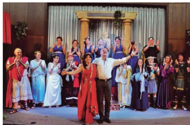
Imagen de archivo de una de las representaciones de la asociación.