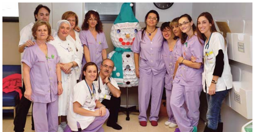
Urgencias Infantil se llevó el premio a la mejor decoración.