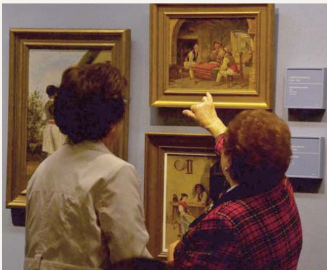
Las personas afectadas por la demencia y sus familiares, destinatarios del proyecto.