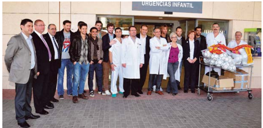
La Selección Absoluta de Fútbol de la Región, en el hospital.