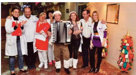
Profesionales del hospital cantando villancicos.