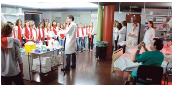
Aguinaldo con el CEIP Santa María de Gracia.