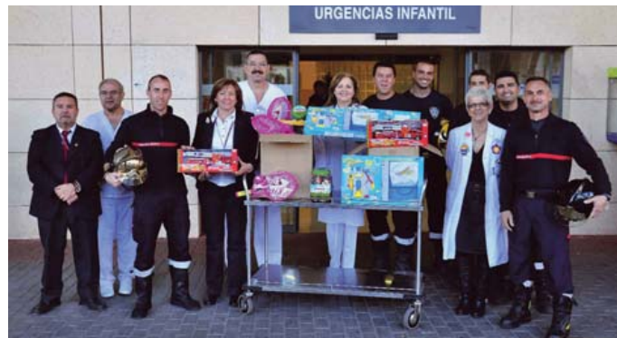
Los Bomberos de Murcia no olvidaron su cita anual con los pequeños de la Arrixaca.