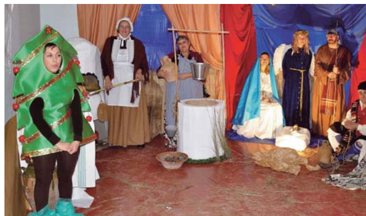
El belén viviente premiado, del Servicio de Reanimación.