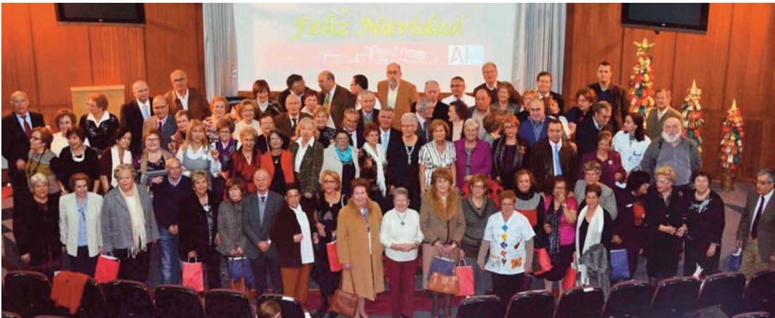
Foto de familia en homenaje a los 115 profesionales jubilados en 2011 en el Área I. Junto a ellos, el equipo de Gerencia.