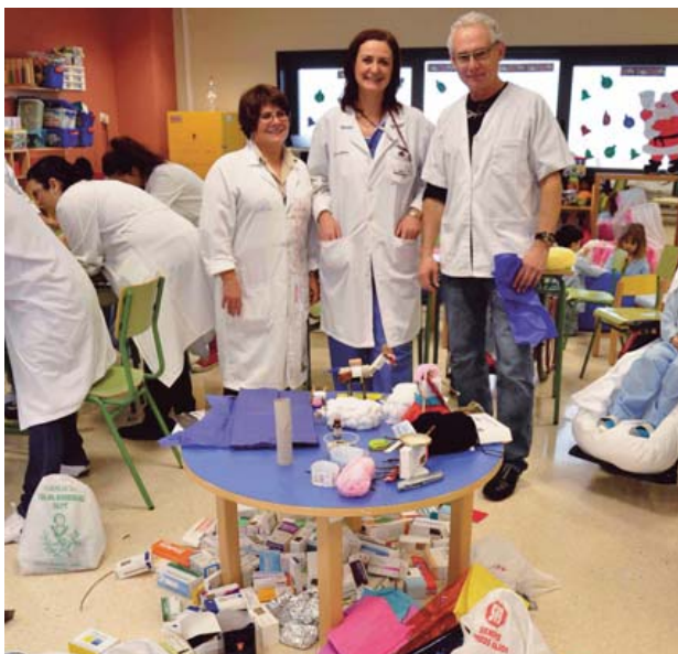
Material reciclado para el belén de las Aulas Hospitalarias.