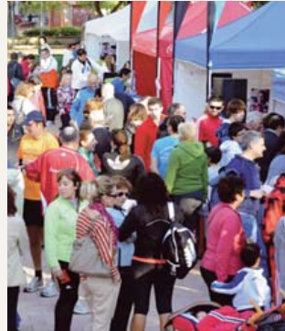
Más de 400 personas, muchas de ellas niños, corrieron los 1.609 metros.