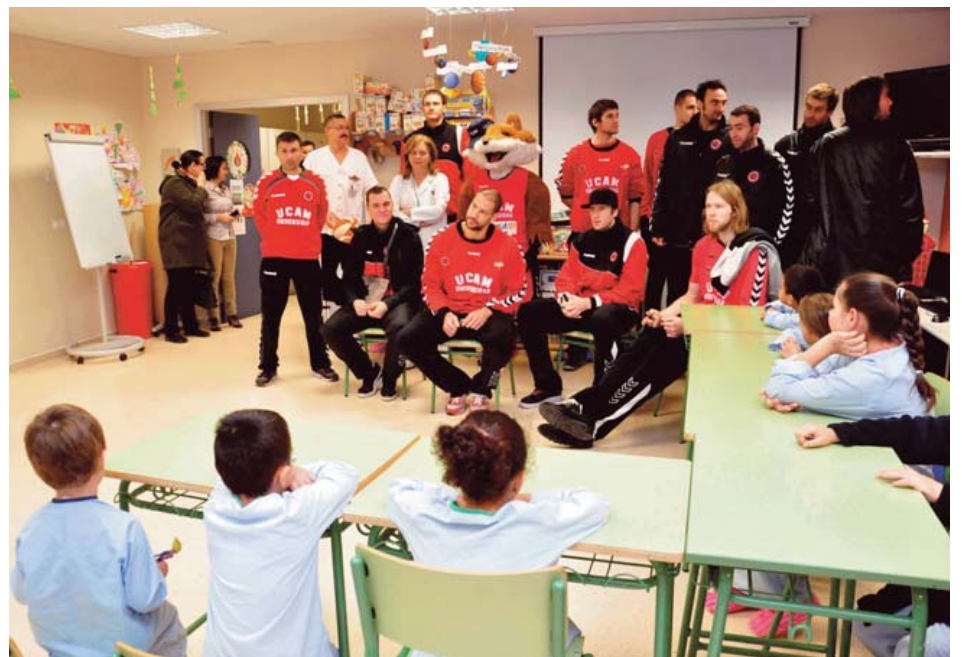
Los jugadores del UCAM CB Murcia, con los pequeños ingresados.