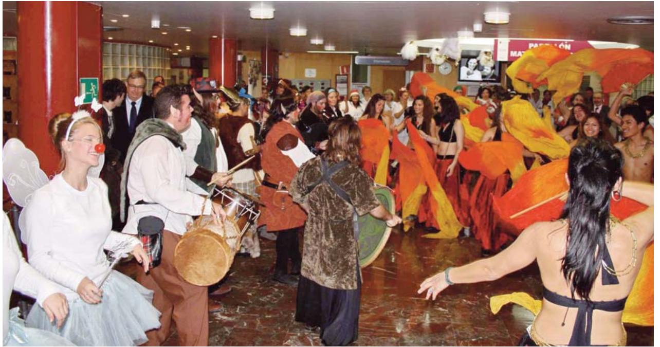
La cabalgata de Papá Noel, llena de colorido y música, hizo bailar a niños y mayores en el hospital.