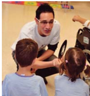
Trucos con los Magos Solidarios.