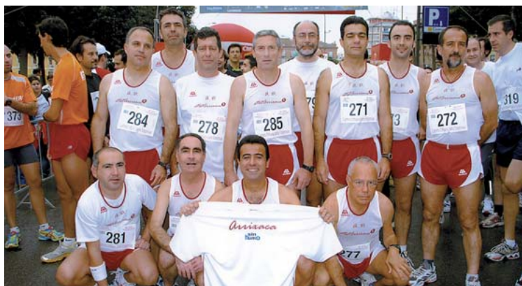
Atletas del Hospital participaron en la VI Carrera Urbana para Empresas-ENAE, en Murcia.

de las constituidas en el Hospital, cuenta con la colaboración de la Dirección, que ha aportado 25 equipaciones completas para los miembros de atletArrixaca. En estos momentos, casi una treintena de profesionales entre celadores, enfermeros, médicos, personal de limpieza