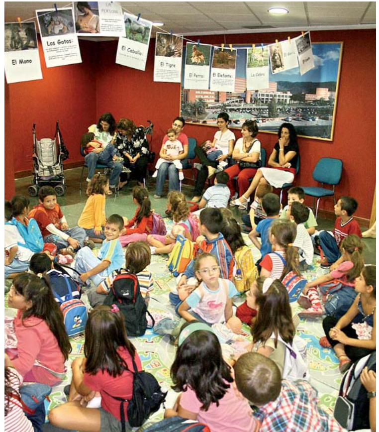
Las madres y los escolares han sido dos de los colectivos destinatarios de esta iniciativa de promoción de la lactancia materna.

gura Martínez. Por esta razón, cuando se coloca a los bebés piel con piel sobre el abdomen y pecho de su madre inmediatamente después de nacer, están alerta y pueden arrastrarse a través de su abdomen hasta alcanzar su seno.