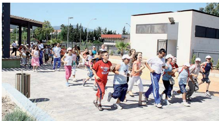
Los niños, protagonistas de una marcha saludable junto al presidente de atletArrixaca.