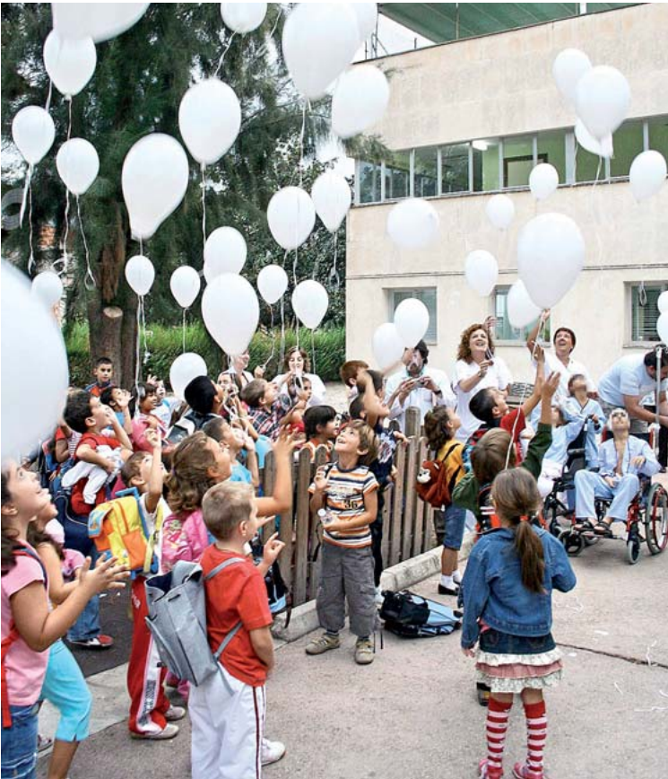
El 3 de octubre se leyó un manifiesto de apoyo a la lactancia materna que culminó con una suelta de globos blancos en los jardines de Centro, a la entrada de consultas infantiles.