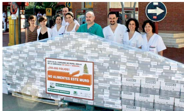
El papel consumido en una semana en la Arrixaca (250.000 folios), convertido en un muro.

dial sin Tabaco, contó con una de las actividades dirigidas especialmente a los escolares. Así, alumnos de los colegios de San Jorge, Santa Rosa de Lima y las Aulas Hospitalarias