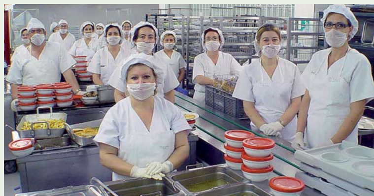
El emplatado de los menús está centralizado en una cinta de unos doce metros de longitud.

Los principios que presiden la actuación de todos los profesionales que desempeñan su labor en este servicio son la calidad, limpieza, higiene, etc., orientados a que los menús lleguen al paciente con un alto grado de fiabilidad en cuanto a posibilidad de toxiinfecciones o alteraciones, sin olvidar la buena presentación y sabor.