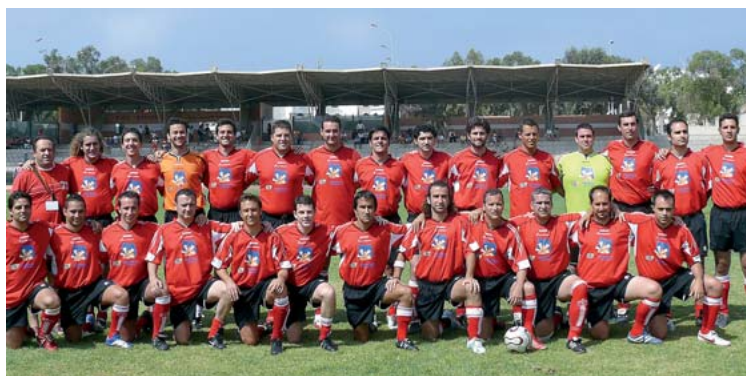
La selección murciana de médicos acaba de lograr su mejor resultado en competición mundial.

dad. Fuimos derrotados por 2-0. Medalla de plata en un torneo de altísimo nivel físico y técnico.