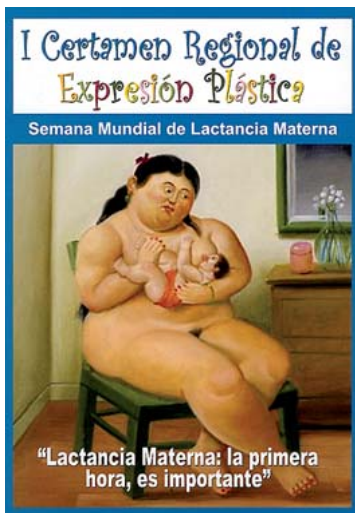
Programa del concurso artístico.

“Los seres humanos somos mamíferos, y, como todos ellos, las crías nacen con el instinto de mamar”, ase-