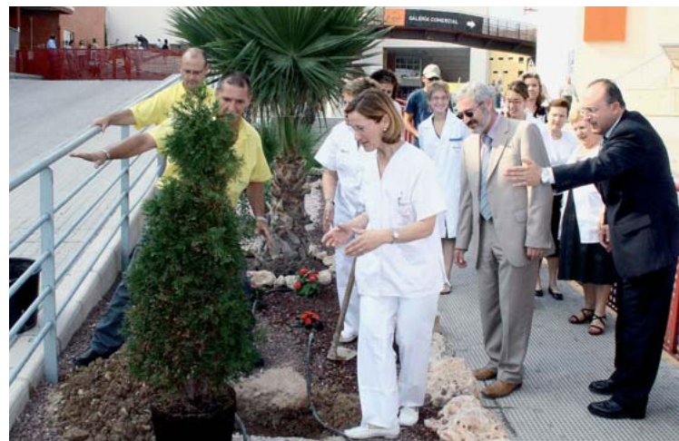
El equipo de matronas plantó un árbol en los jardines de la Arrixaca: 'una vida, un árbol'.