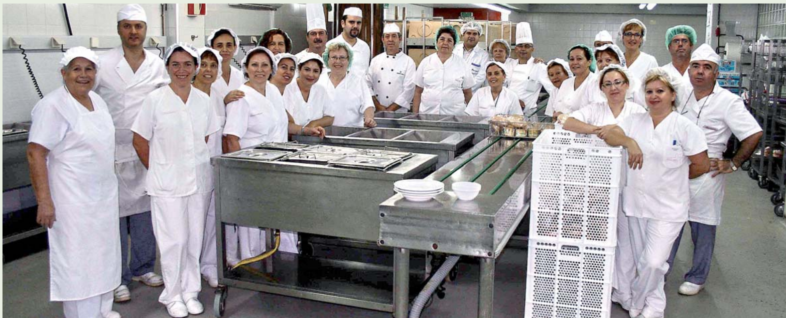
Algunos miembros del equipo del Servicio Central de Cocina, en las instalaciones del Hospital Universitario Virgen de la Arrixaca.