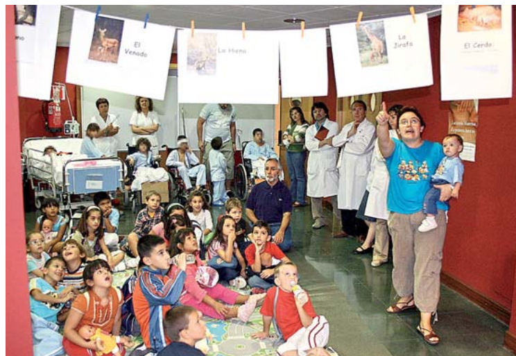
Las Aulas Hospitalarias acogieron charlas y actividades plásticas sobre lactancia.