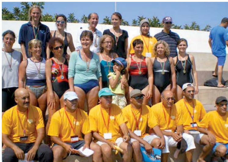
La convivencia y el contacto con profesionales de los cinco continentes, la mejor medalla.

Ya sólo quedaba la final frente a Nápoles, equipo con gran experiencia (6 finales y 2 campeonatos) y cali-