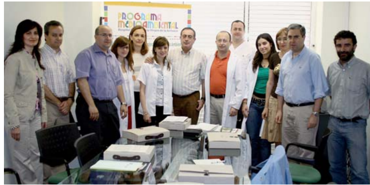
Los organizadores de la 'semana verde' junto a responsables de salud ambiental de otros hospitales.

La primera jornada de la 'semana verde', la dedicada al Día Mun-