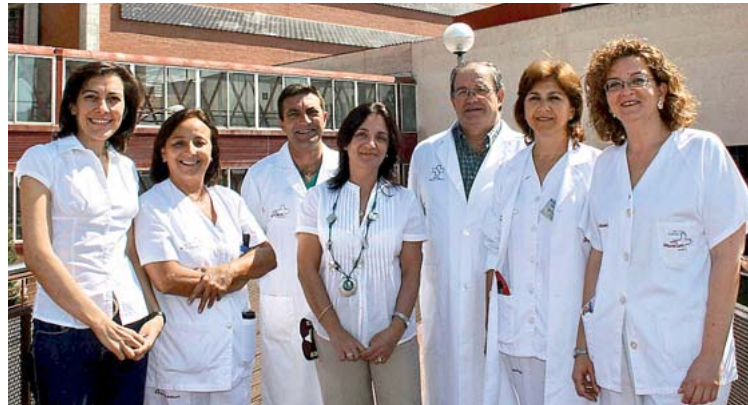
Algunos de los miembros de los comités organizador y científico de la XXIX edición.

Otros puntos que han sido objeto de talleres, mesas redondas y ponencias son la actuación de Enfermería en los trasplantes renales, los