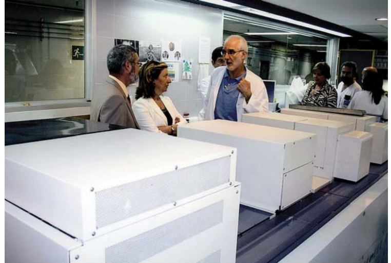
La primera visita oficial de la titular regional de Sanidad a la Arrixaca tuvo lugar el 24 de julio.