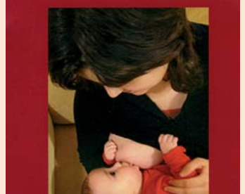
El apoyo a la lactancia, permanente.

Los niños de hoy serán los adultos del mañana