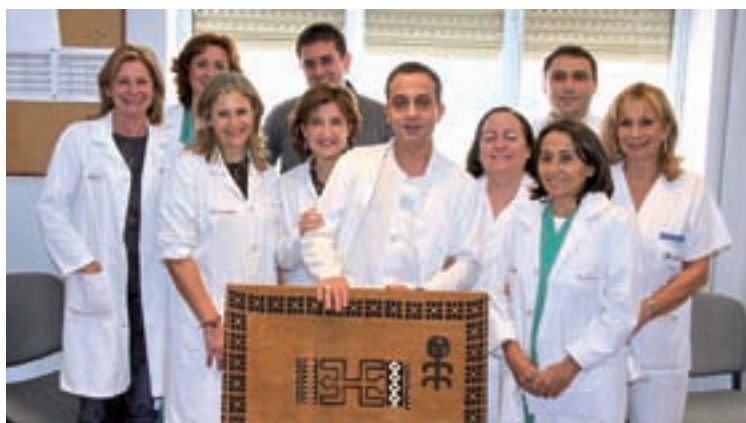
Algunos miembros y colaboradores de la ONG regional Amigos de Mali.

mio nacional al mejor centro de salud. Sin embargo, otro motivo del viaje a Doumanabá fue el de abrir un nuevo pozo para abastecer al poblado y al propio CSCOM.