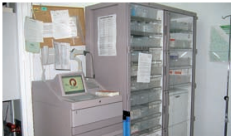
Armario de dispensación automática de Observación de Urgencias.

Facilitan y reducen tiempos de Enfermería dedicados a logística en aras de una mayor dedicación asistencial, mejorando la gestión de los recursos humanos.