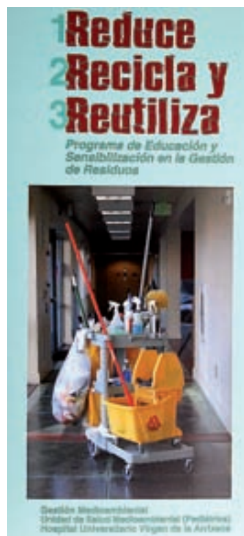
Tríptico editado por la Arrixaca.

citostáticos y los radiactivos. Los biosanitarios especiales son los potencialmente contagiosos y capaces de transmitir enfermedades contagiosas. Éstos se han de depositar en contenedores con bolsa roja, excepto el material cortante o punzante, que se deposita en contenedores específicos, generalmente amarillos. La Arrixaca produce 290 toneladas al año de estos residuos.