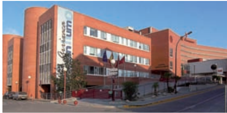
La Arrixaca, organizador y sede del VI Congreso Regional de Calidad Asistencial.