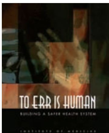
Portada de 'Error es humano'.

La implantación de los SAD permite sustituir el botiquín de planta o bien el sistema de dispensación por dosis unitarias, facilitando al perso-