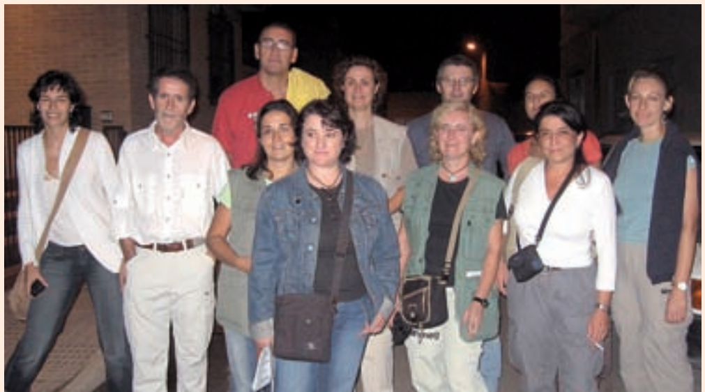
Cirugía Solidaria implica a toda la Arrixaca, que siente el proyecto como suyo y le da cobertura material, legal y afectiva.