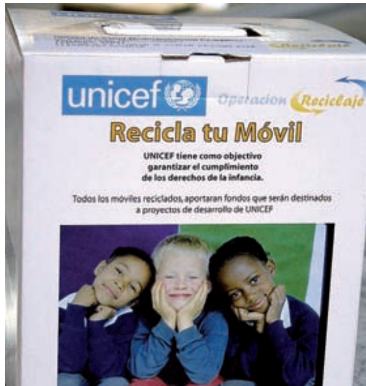
En colaboración con Unicef, la Arrixaca tiene en marcha una campaña de reciclaje de móviles.

El 20% de residuos restantes son los considerados peligrosos, en los que se incluyen los recipientes o envases que los hayan contenido. Esta categoría engloba los residuos biosanitarios especiales; los sanitarios químicos; los residuos sanitarios