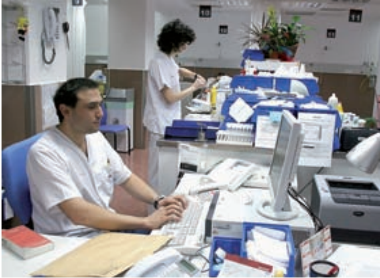
Control de Enfermería de la Unidad de Prehospitalización.