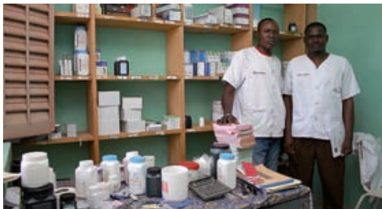
Dos trabajadores del centro de salud de Doumanabá, inaugurado hace dos años.

Además de haber iniciado ya los trámites para construir el cuarto CSCOM Amigos de Mali, la delegación regional que se trasladó al país en este último viaje aprovechó la ocasión para visitar el centro de salud de la comuna de Doumanabá, inaugurado hace dos años y cuyo prestigio le ha hecho merecedor de un pre-