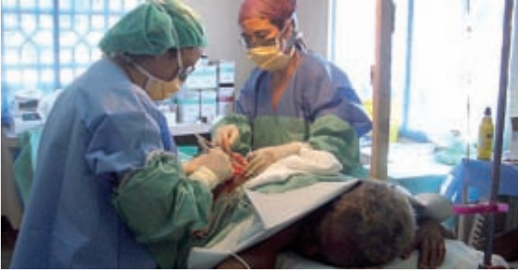
El equipo de Cirugía Solidaria montó dos quirófanos en el dispensario de Bengbis.