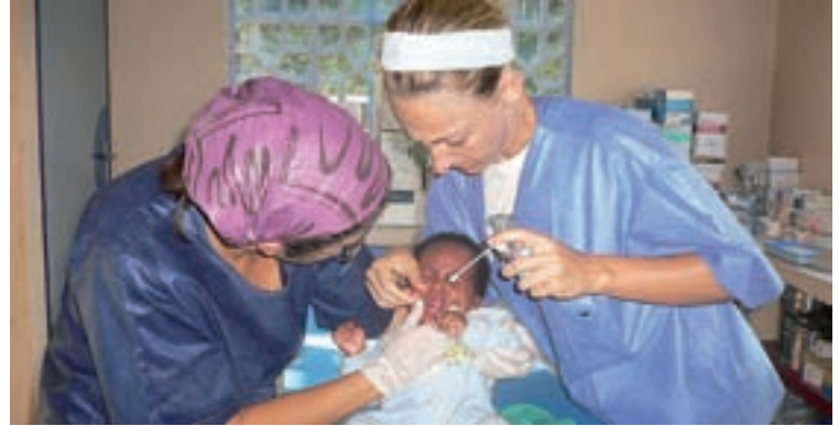
Si no se le hubiera extraído un diente a este bebé de un mes, habría muerto en pocos días.