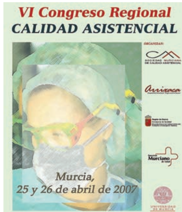
Programa anunciador del congreso.

tivos, enfermeros y un largo etcétera. En este sentido, el alto índice de aportación de comunicaciones, tanto orales como pósters, avala la evolución positiva del congreso, al que este año se estima que se presentarán unas 200 comunicaciones.