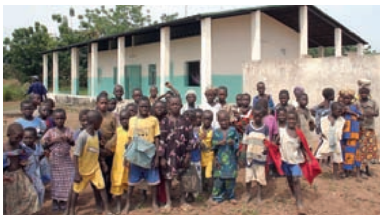
En Kafana, Amigos de Mali ha construido, además de un CSCOM, una escuela.