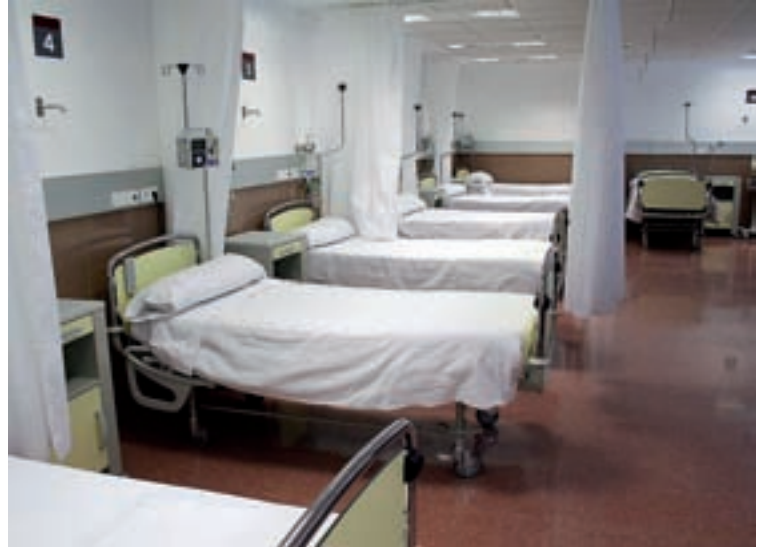
La nueva área, concebida como sala diáfana abierta con una zona de control centralizado.