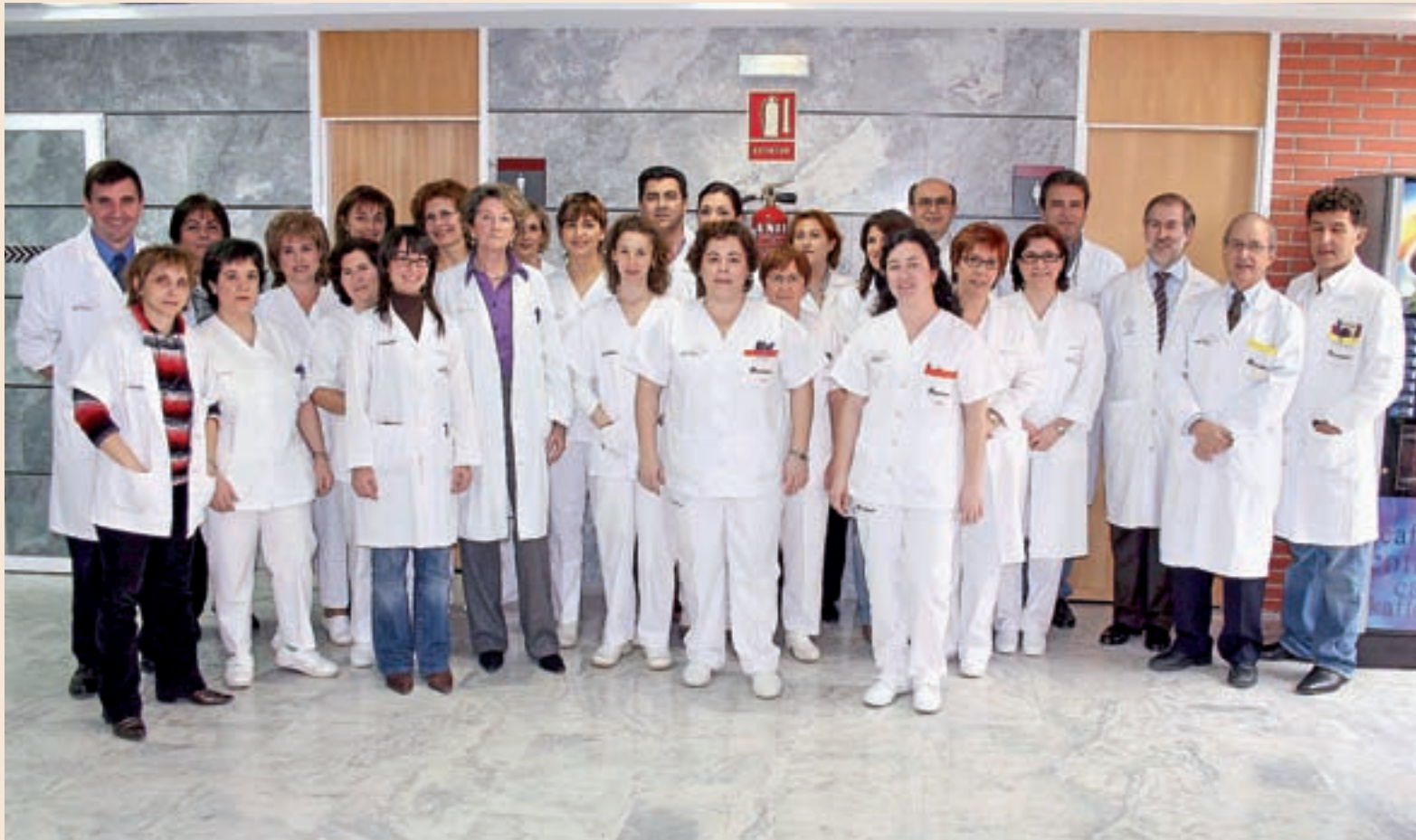
El equipo del Servicio de Microbiología de la Arrixaca, formado por un jefe de Servicio, dos jefes de Sección, 6 facultativos, 2 residentes, 6 enfermeros, 16 técnicos y 3 auxiliares administrativos.