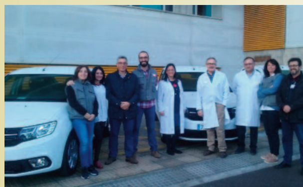
Nueva dotación de vehículos para el Equipo de Atención Domiciliara del Hospital del Rosell

Habrà un incremento quirúrgico del Complejo Hospitalario de Cartagena con la puesta en funcionamiento de todos los quirófanos existentes del hospital del Rosell para realización tanto de cirugía mayor ambulatoria como de cirugía con ingreso. De esta manera, se optimizará la actividad de estos diez quirófanos y se reforzará la Unidad de pacientes críticos quirúrgicos con la contratación de especialistas de anestesiología y de cuidados intensivos.