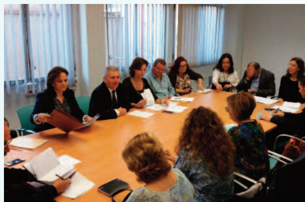
Reunión de todas las áreas de salud que integran el SMS para analizar las actuaciones en este campo.