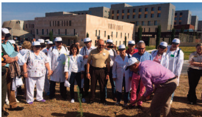
Este día tuvo lugar la charla "Cáncer y medioambiente"